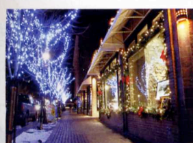
7. スキー場開設から60年を迎えたアスペン。アスペン・マウンテン、アスペン・ハイランズ、バターミルック、スノーマスの山を共通リフトチケットで周遊可能。高級店があちらこちらに