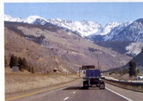
2. コロラドには、26のスキー場がある。このサイトでは積雪、天候など、各種ガイドがあり便利。 www.coloradoski.com

相田武将・文 Text by Takemasa Aida 丸茂昌勝・文・写真 Text & Photo by Masakatsu Marumo