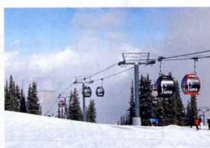
6. アスペンでは犬も家族同様。レストハウスに犬と行く時は赤い Gondola を使うこと。アスペンはウィンターXゲーム開催地としても知られる。ボードも滑走可能。デンバー、ロサンゼルス、サンフランシスコからのアクセスも可能。