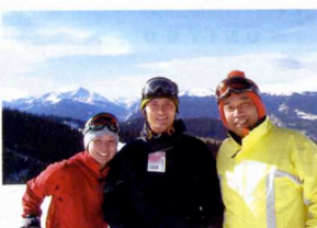
5. ボク（写真中央）プロを目指していたスノーボーダー。先輩（写真右）80年代スキーブームを経験しているハワイ大好き、軟弱スキーヤー？（写真左）偶然出会ったインストラクター。彼女のサイトは www.GoSkiAmerica.com