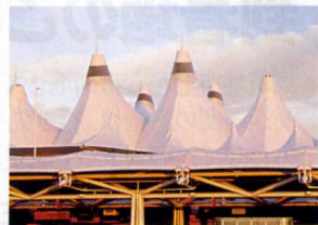
1. デンバー国際空港は、全米の空路のハブ（中継点）として、1日の発着は1500便以上！ ロッキー山脈をイメージしているターミナルの屋根。