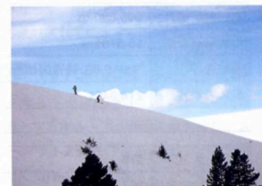
4. このような広大なコースが無数に広がる。さすがアメリカはBIGだ！！

続いて訪れたアスペンスキーリゾート。ベイルからシャトルバスで2時間。ベイル同様に広大なゲレンデとパウダースノーが僕らを迎えてくれた。かつて銀鉱の街として栄えたアスペン。