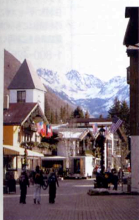
3. ベイルビレッジを中心に100軒以上のレストラン、アパレル、スキーショップは、250店舗以上。

デンバー国際空港からシャトルバスで西に2時間、ロッキーマウンテンに位置する北米最大規模を誇るベイルスキー場。コロラド州は、年間約300日が晴天に恵まれ、しかも湿度が低い。だから、最大標高約3